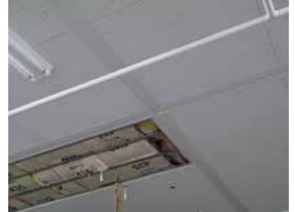
精密機器工場（岩手）